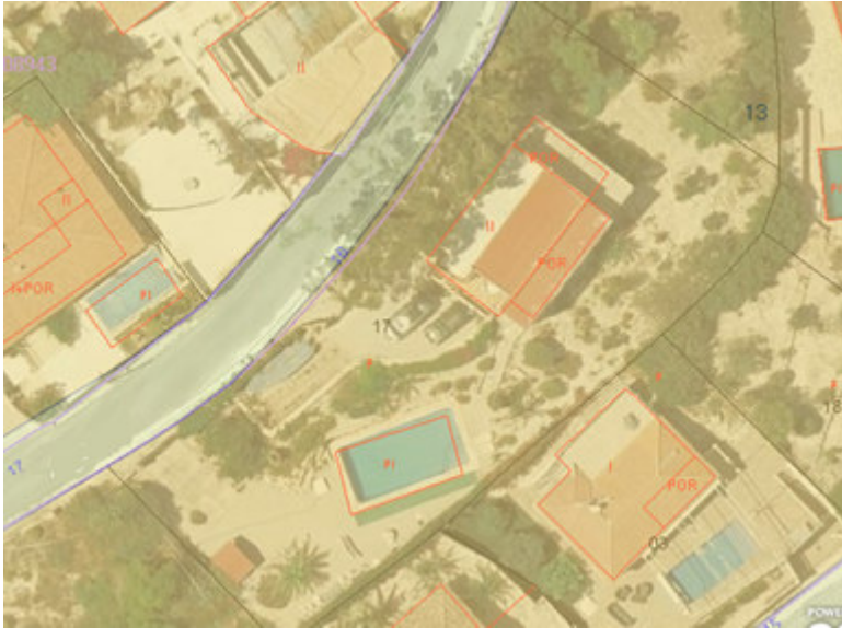
Fotografía aérea de la parcela actual