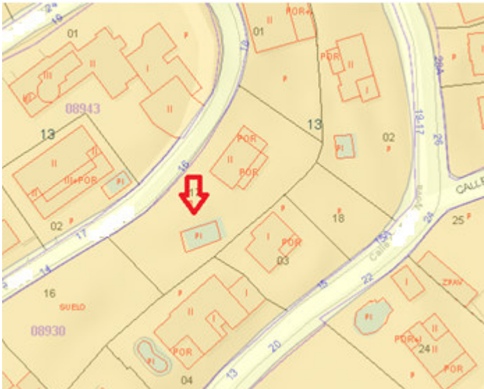
Parcela afectada. Geoportal Ayuntamiento de El Campello.