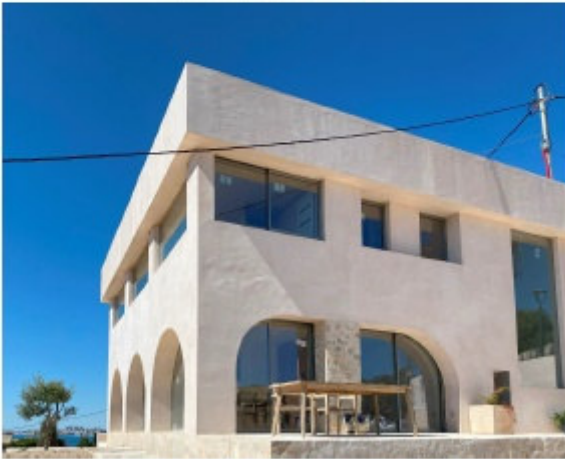
Foto 07: Cubierta 02 - Estado reformado. Vista norte. Ubicación original de la cubierta 01 demolida.

A la izquierda de la imagen se aprecia el hueco ampliado en las obras ejecutadas.