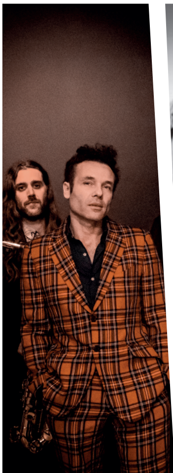
Dijous 30 juliol - 22H LOS SAXOS DEL AVERNO