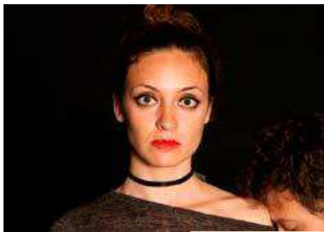
Teatro en valenciano