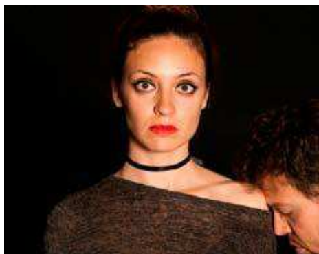
Teatre en valencià